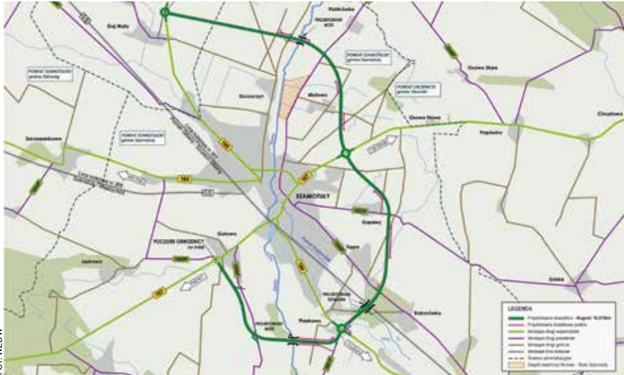
Taki będzie przebieg szamotulskiej obwodnicy.

Rozpoczyna się budowa ważnej obwodnicy Szamotuł.