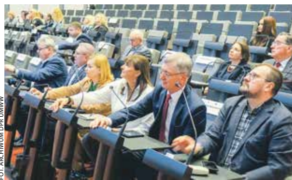
Członkowie KM FEW jednogłośnie poparli zmiany.

Dotyczą one kilku obszarów. Na pierwszy plan wysuwa się rezygnacja z poręczeń w instrumentach finansowych dla przedsiębiorców. Powodem są skomplikowane zasady ich wdrażania i rozliczania. W podobnym kierunku podąża zdecydowana większość regionów w kraju. Istotną nowość czeka na przedsiębiorców z Wielkopolski wschod-