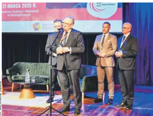
Konferencja odbyła się 21 marca w Kozięglowach.

W trakcie panelowych dyskusji rozmawiano m.in. o szeroko rozumianym rozwoju JST i ich przyszłości, w tym o możliwych kompetencjach, partycypacji mieszkańców, zainteresowaniu młodych ludzi pracą w urzędach, a także o roli mediów lokalnych. RAK