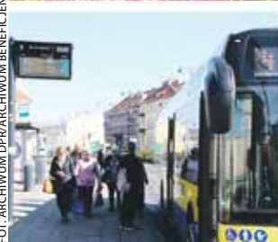
Transport niskoemisyjny i klimat to dwa obszary, które zdominują najbliższe konkursy z FEW.

nego, jak również na realizację działań związanych z budową lub modernizacją infrastruktury, np. zajezdni i przystanków. Wsparciem objęte będą także inwestycje w centra przesiadkowe, parkingi.