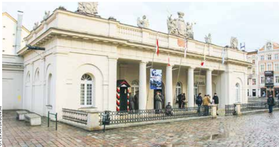
Odwach na Starym Rynku przez wieki był w rękach służb mundurowych.

Co wiemy o zmieniających się przez wieki budowlach służących tym, którzy mieli bronić miasta?