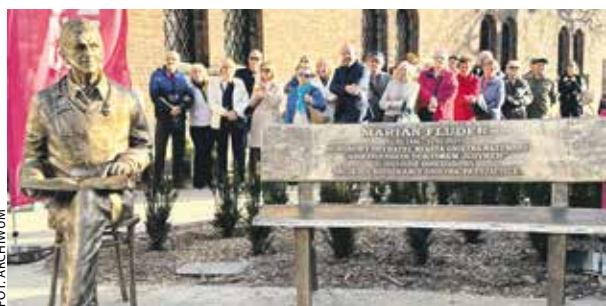
Uroczystość połączenia z odsłonięciem pomnika poświęconego patronowi skweru.