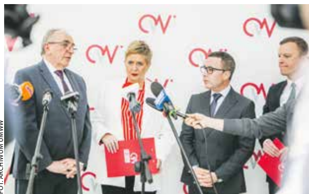
W Ostrowie Wlkp. o kolei dyskutowano 10 marca.

Samorządowcy poparli inicjatywę powstania i rozwoju kolei aglomeracyjnej, dostrzegając realną szansę na poprawę sytuacji transportowej w południowej Wielkopolsce i przeciwdziałanie wykluczeniu komunikacyjnemu. Mieszkańcy chętnie wybiorą ekologiczną, szybką i komfortową podróż pociągiem, ale konieczne jest zwiększenie siatki połączeń z i do Ostrowa Wlkp. oraz Kalisza.