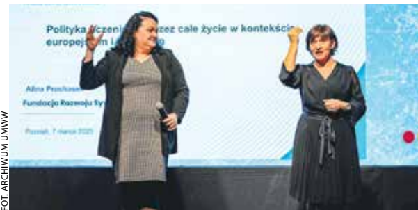
Konferencja odbyła się 7 marca na MTP.

Na MTP w Poznaniu zorganizowano 7 marca konferencję pn. „LLL po wielkopolsku! – współpraca na rzecz uczenia się przez całe życie”.