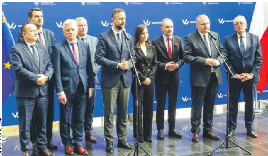
O współpracy wojska i samorządów mówiono też podczas briefingu prasowego.

W wydarzeniu, którego gospodarzami byli wicemar-