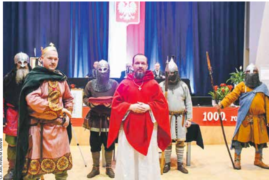
Podczas uroczystych obrad w Gnieźnie nie zabrakło historycznych akcentów.

Marszałek dodał, że z przeszłości oprócz dumy należy czerpać również wnioski: – Historia Bolesława Chrobrego i początków państwa polskiego pokazuje nam, że sukces państwowości należy opierać na dwóch filarach.