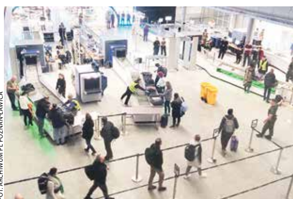
Stanowiska kontroli na Ławicy są teraz umiejscowione nieco inaczej niż wcześniej, a po ich przejściu trafia się bezpośrednio do sklepu Baltony.

Stanowiska kontroli są obecnie umiejscowione nieco inaczej niż wcześniej, a po ich przejściu trafia się bezpośrednio do nowego, dużo większego sklepu Baltony. To teraz nowoczesny multistore o powierzchni 900 m 2 , wyposażony m.in. w duże ekrany LED-owe, na których wyświetlane są także treści nawiązujące do Poznania i Wielkopolski. Odmieniony wygląd zyskały też zarządzane przez Baltonę punkty gastronomiczne.