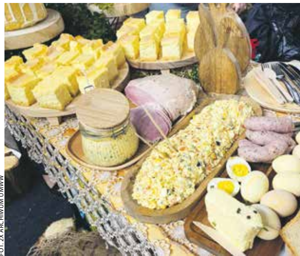
Zarówno w Pile, jak i w Chrzanie nie zabrakło smakowitych propozycji na wielkanocny stół.

Samorząd województwa był organizatorem konkursów, które pozwoliły przypomnieć regionalne wielkanocne tradycje i smaki.