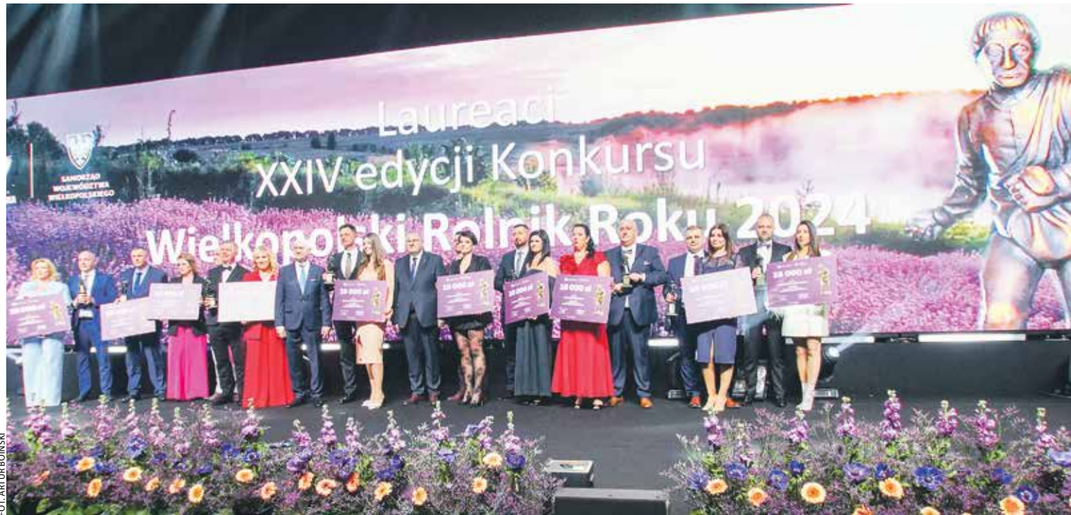
Laureaci konkursu odebrali statuetki Siewcy i symboliczne czek na scenie Sali Ziemi MTP.