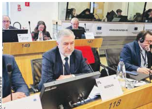
Posiedzenie komisji COTER z udziałem marszałka Marka Woźniaka.

Trwają dyskusje o tym, jakie skutki przyniosła dotąd unijna polityka spójności i jaki – w kontekście kolejnego budżetu UE i stojących przed Europą wyzwań – powinien być jej kształt w przyszłości.