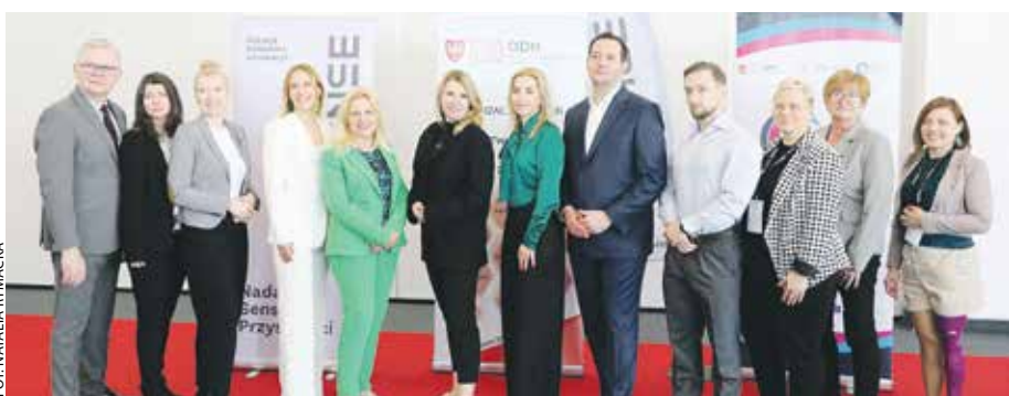
Projekt zainaugurowano podczas Targów Edukacyjnych w Poznaniu.

Podczas odbywających się w marcu Targów Edukacyjnych w Poznaniu zainaugurowano projekt „Włącz_POPOJUTRZE! Generator pomysłów dla edukacji”.