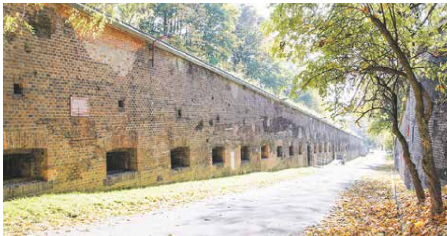
Z niemieckich, zaborczych jeszcze czasów przetrwały m.in. fragmenty umocnień Cytadeli.